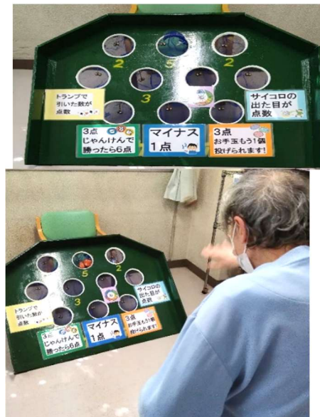
↓《自作ターゲットボウルとプレイ中の様子》

今回はOTの集団レクリエーションで行っているゲームの1つを紹介したいと思います。「ターゲットボウル」といい、本来はゲートボールの様にスティックを使用してボールを穴に入れるゲームです。1度やってみたのですが、車椅子の患者さんがスティックを持って構えることができませんでした。そこでお手玉を投げるゲームに変更したのですが思った以上に好評で月に何度か行っています。